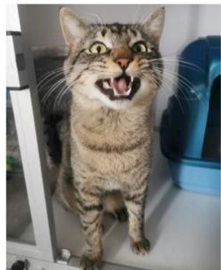
Ross adore la compagnie humaine.

Né en avril 2023, Ross vient de la rue, du froid, de la faim et de la douleur. Il a été recueilli le 13 février dernier et n'a jamais été réclamé auprès de la fourrière.